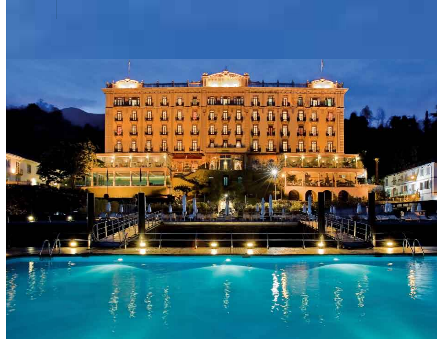
Sopra, il Palace e la piscina galleggiante del Grand Hotel Tremezzo. In basso, terrazza e idromassaggio di una delle nuove Rooftop Suites.

Nelle memorie del Grand Hotel Tremezzo, anche i soggiorni di Greta Garbo. Un simbolo del lusso che da sempre si rinnova