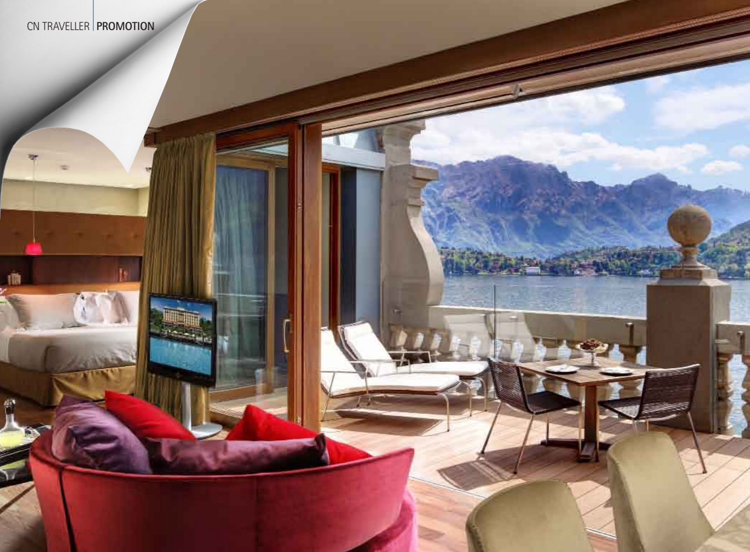
Qui sopra, una delle Rooftop Suites. Sotto, le tre piscine nella T Spa, nel parco secolare e quella flottante sul Lago di Como.